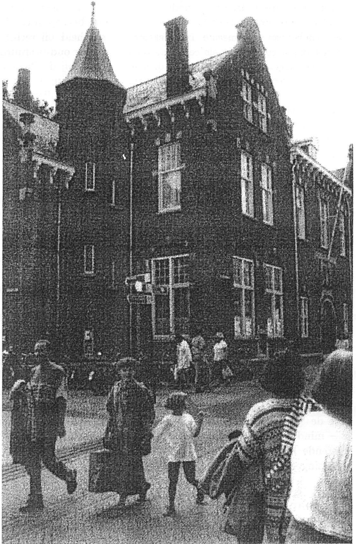
Het postkantoor in Bergen op Zoom.

advies geen melding is gemaakt, heeft echter geen concreet onderzoek aan het licht gebracht. Dat bevreemdt overigens niet, daar zich ook tussen de gedingstukken niet een dergelijk onderzoek bevindt. Het blijken de pleitnota van burgemeester en wet-